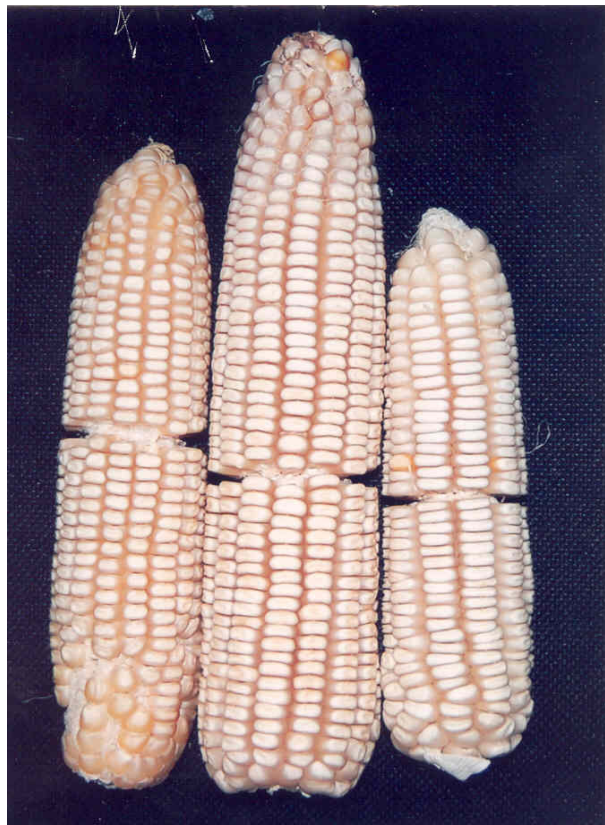
ფეროგვაშო 4 TSEROVANI 4

NAME OF PLANT VARIETIES IN THE APPLICANT'S LANGUAGE: Maize "TSEROVANI 4"