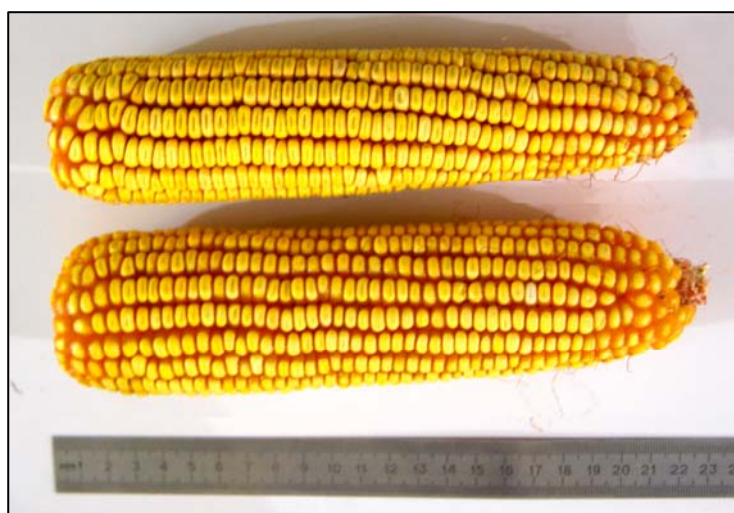
წილკანი 2 Tsilkani 2

Grain yield on normal agro-background makes up 8-9 ton on a hectare. It is recommended to be spread in east regions of Georgia as irrigative as well as non-irrigative regions.