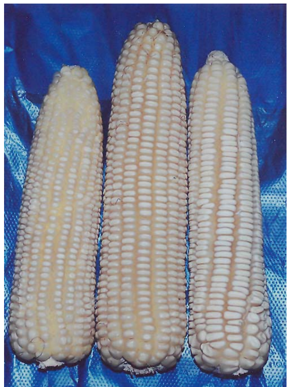
ფეროგრაფი 5 TSEROVANI 5

NAME OF PLANT VARIETIES IN THE APPLICANT'S LANGUAGE: Maize "TSEROVANI 5"