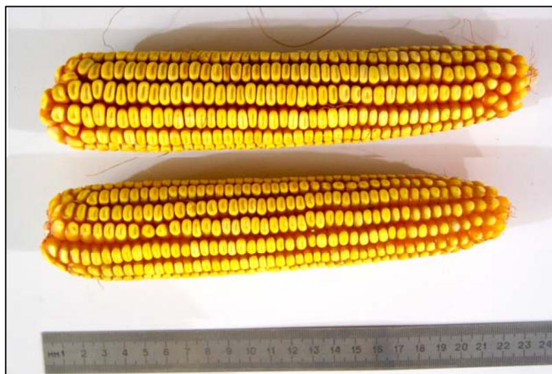
წიკანი 1 TSILKANI 1

Grain yield on normal agro-background makes up 9-10 ton on a hectare. It has universal direction as for food-stuffs, as well as for forage. It is recommended to be spread in east and west regions of Georgia which produces maize.